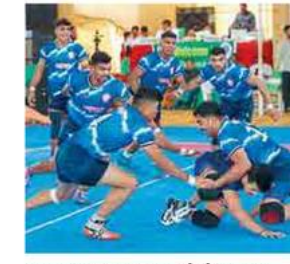
महाराष्ट्र-गुजरात लढतीतील क्षण.

आक्रमक सुरुवात करीत पूर्वार्धातच २ लोण देत महाराष्ट्राने २८-१३ अशी भक्कम आघाडी घेतली. उत्तराधीत खेळ थोडा धीमा करीत महाराष्ट्राने आणखी एक लोण